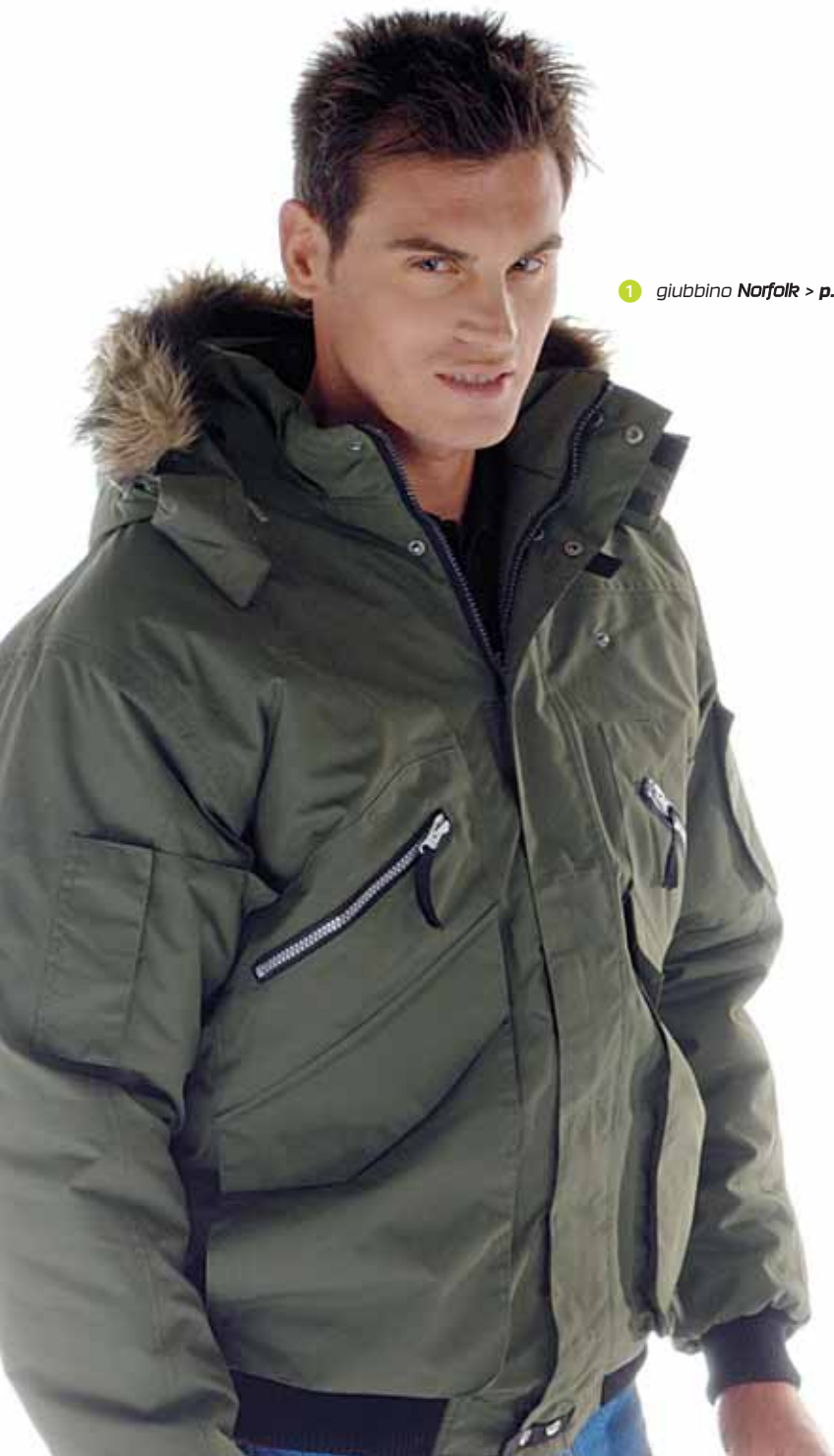
1 giubbino Norfolk > p. 95