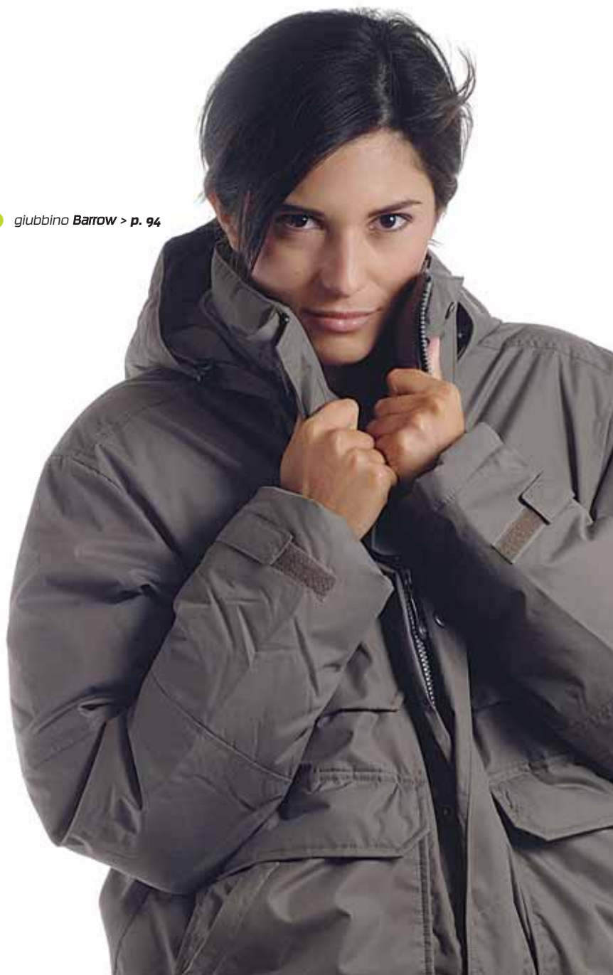
2 giubbino Barrow > p. 94