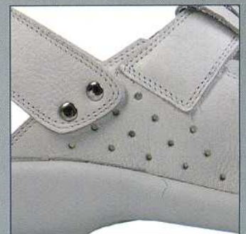
Esempio di foratura lato interno