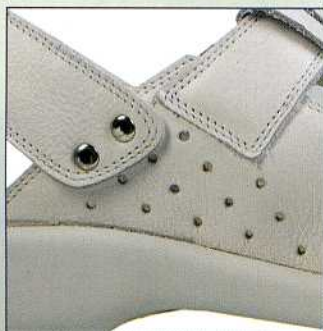
Esempio di foratura lato interno